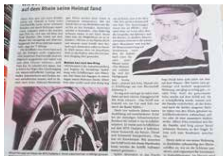
Bericht „Wie Seebär Albert Fritz seine Heimat auf dem Rhein fand“ in „Schweiz. Ausflüge, Touren und Outdoortips“ 20/11/2010

Erhältlich im Sekretariat Fachliteratur auf Bestellung mit 20% Rabatt REKA-Checks – 1'000 Franken mit 20% Ermässigung Nautilusartikel Kappen, Mützen, Kugelschreiber, Mausmatten usw. «Ich kenne meine Rechte» Lehrlingskalender von A bis Z